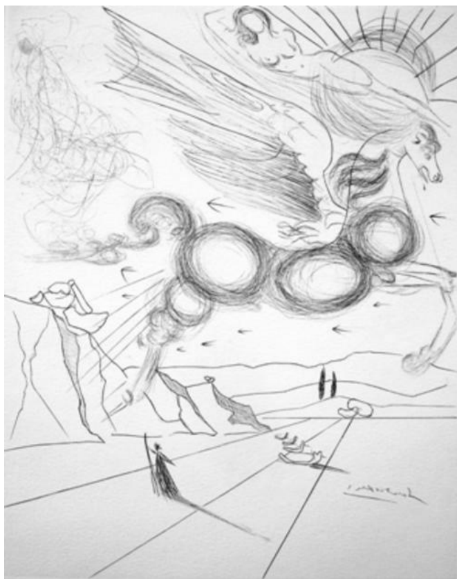
Fig. 2 – Salvador Dali, "Pegasus in Flight with an Angel"