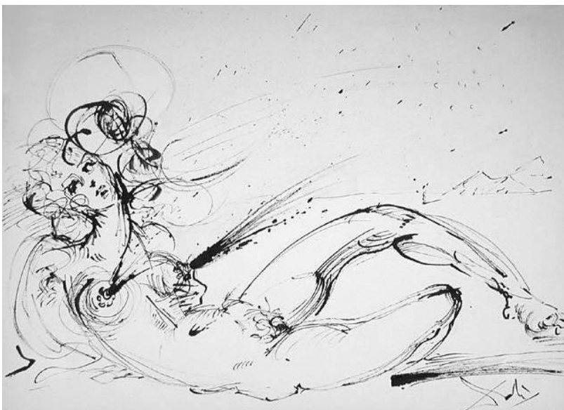
Fig. 3 – Salvador Dali, "The Milky Way"

Analise as figuras acima representadas. Usando partes destas três imagens, elabore uma composição fazendo o uso de lápis no interior do quadrado que pode ver na página seguinte, preenchendo todo o seu espaço. A composição deve expressar movimento, diferenças de tamanho e ritmo .