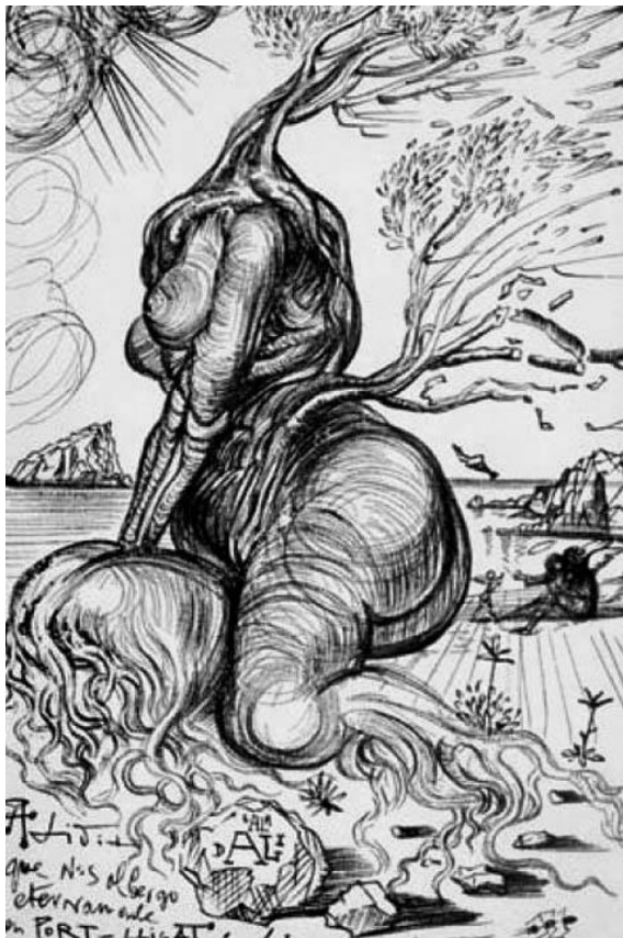
Fig. 1 – Salvador Dali, "Lidia de Cadaques"