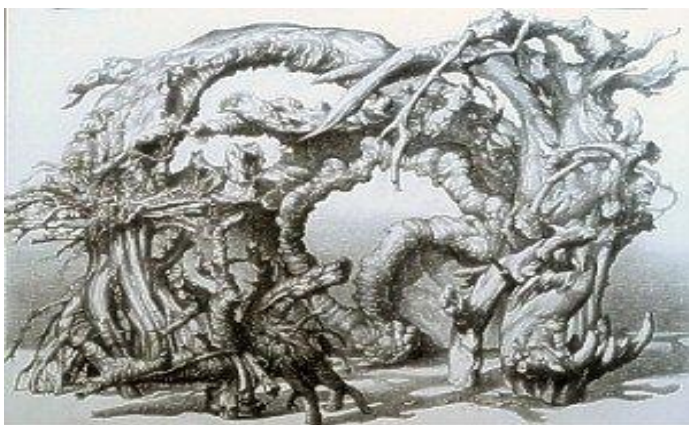
Paul Gorka, (Roots and things)

Analise as figuras abaixo representadas. Usando partes destas duas imagens, elabore uma composição fazendo o uso de lápis no interior do quadrado que pode ver na página seguinte.