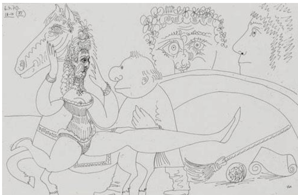
Pablo Picasso, (Ecuyère)